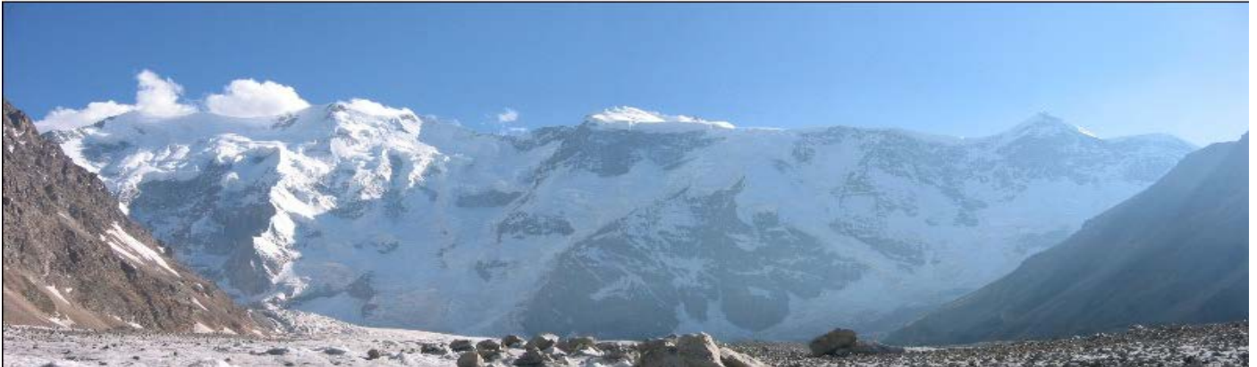
Вид снизу на Большую Безенгийскую Стену с “поворота” ледника. Гестола (фотография на обложке) да и вся стена издали смотрятся гораздо величественнее.

Тогда ничего подобного я ещё не видел. Во-первых, перепад в 3 км – это всегда впечатляет. Во-вторых, их там две: большая и малая. Из 7 “пятитысячников” Кавказа в Безенги их – 5, (а 2 ещё – это известные всем Эльбрус и Казбек). В Большой Безенгийской Стене из пяти – 3, но зато от Гестолы и до Дых-Тау все вершины выстроились прямой стрункой на фоне синего неба. И главное, где-то посередине высоты висят матово сине-зелёные льды. Утром, когда лёд сверкает под лучами восходящего солнца, – глаз не отвести от этого цветного глубинного сияния особенно в сочетании с белизной снегов ещё выше. Вечером, контраст и цвета уже не отвлекают, и тогда громада висячих